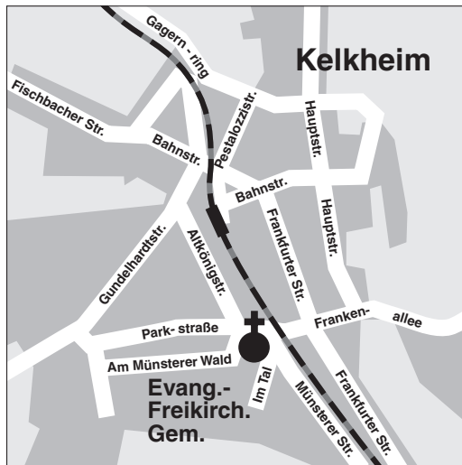
Ausschnitt der Stadtkarte Kelkheim